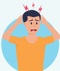
Dolor de cabeza