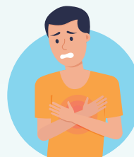
Dificultad para respirar