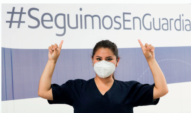
En EsSalud, #SeguimosEnGuardia, velando por todos nuestros pacientes.

En la semana epidemiológica 40, que fue del 27 de setiembre al 3 de octubre, continuamos registrando un descenso consistente en la tasa de positividad en nuestra institución a nivel nacional. Esta información es alentadora, pero lejos de sentirnos confiados por los resultados positivos del trabajo institucional, en EsSalud, #SeguimosEnGuardia, redoblando esfuerzos y velando por la salud de todos nuestros pacientes a nivel nacional.