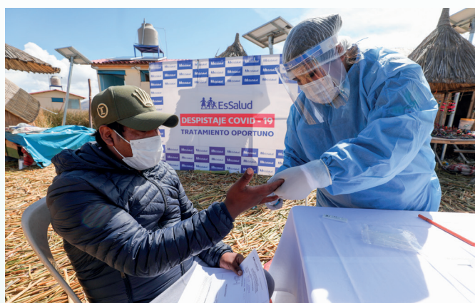
En EsSalud a nivel nacional, de cada 100 hombres testeados para SARS-CoV-2, 23 dieron positivo durante la semana del 27 de setiembre al 3 de octubre.

Mientras tanto, en hombres, la tasa de positividad fue mayor que en mujeres: 23.43%. En otras palabras, de cada 100 hombres testeados por SARS-CoV-2, 23 dieron positivo.